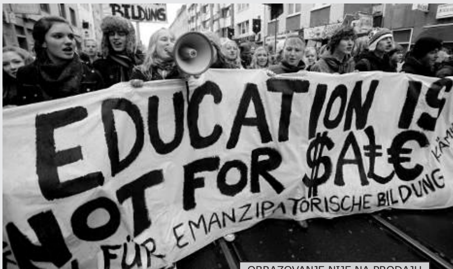
OBRAZOVANJE NIJE NA PRODAJU