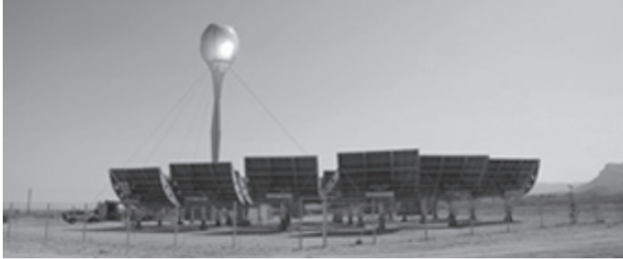
Солнечная электростанция в современной израильской киббуце Самар - коммуне, основанной на анархистских и экологических принципах

"Планирование" экономики анархического общества не должно быть централи-